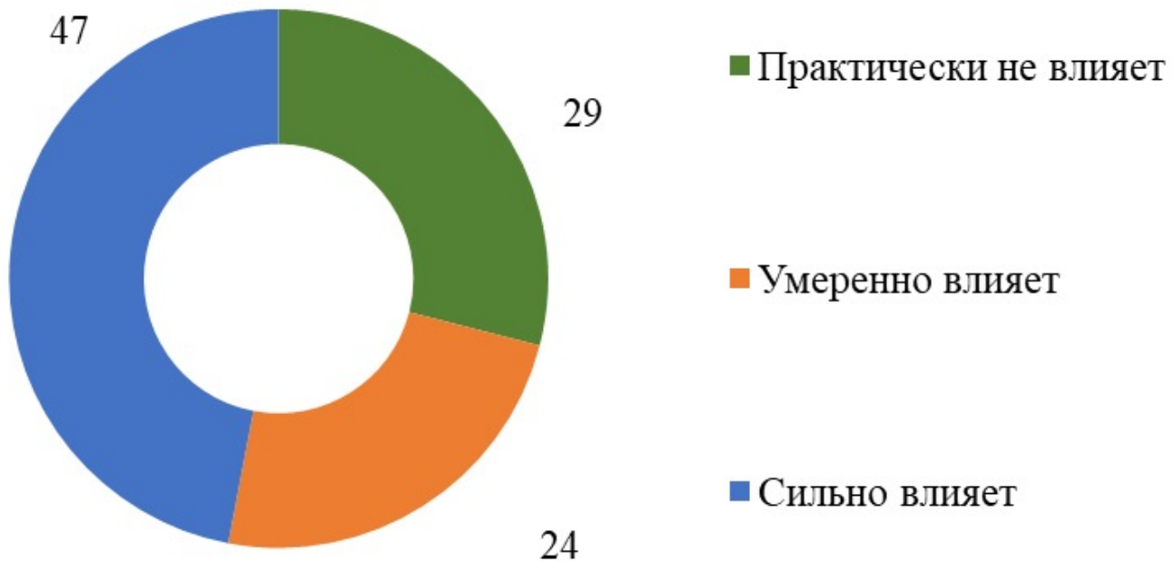
Рис. 2. Ответы на вопрос: «Насколько сильно выгорание влияет на Вашу жизнь?», % (составлено авторами 3 ).

состояния, несоответствие ожиданий от профессии и реальных возможностей, ограниченный доступ к современным методам диагностики и лечения).