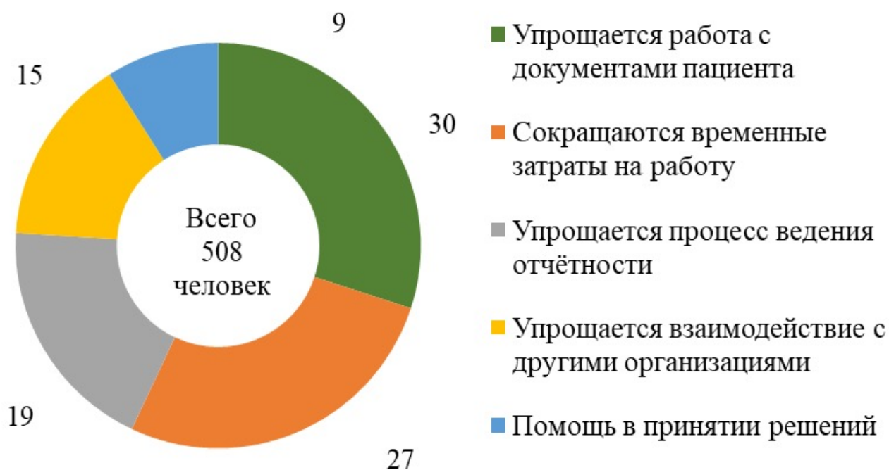
Рис. 2. Ответы на вопрос: «Как Вам помогает цифровизация в здравоохранении», % (составлено авторами 5 )